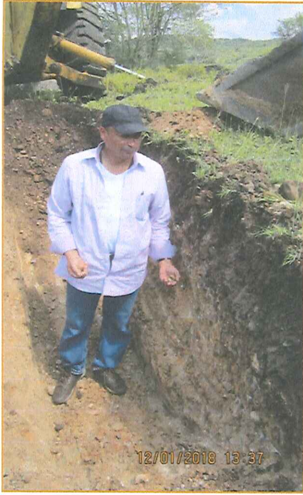
FOTOGRAFÍA 4. Revisión del avance del Sondeo, Trch – 02, exploración preliminar de contactos y litologías.