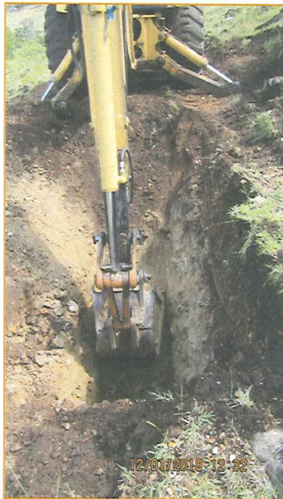
FOTOGRAFÍA 3. Detalle del avance del Sondeo, Trch – 02, exploración preliminar de litologías.