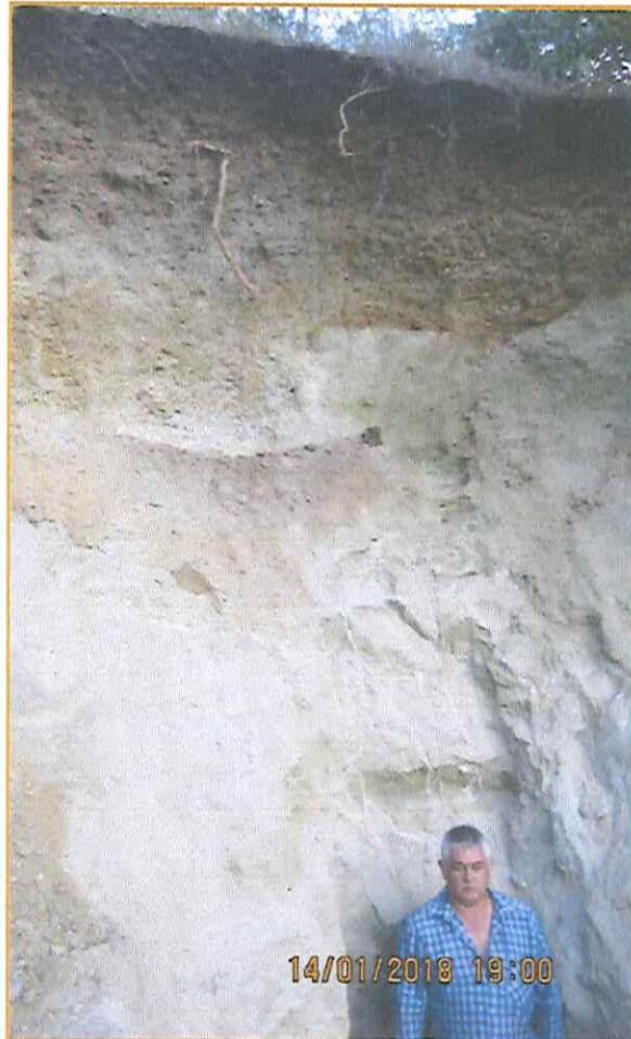
FOTOGRAFÍA 5. Aspecto de la litología, Apq – 05, exploración preliminar de litologías.